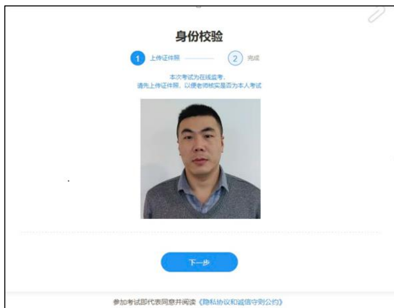
图 2 上传证件照