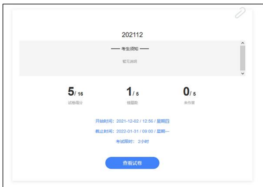
图 9 考试详情页面