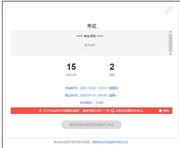
图 6 电脑桌面截屏