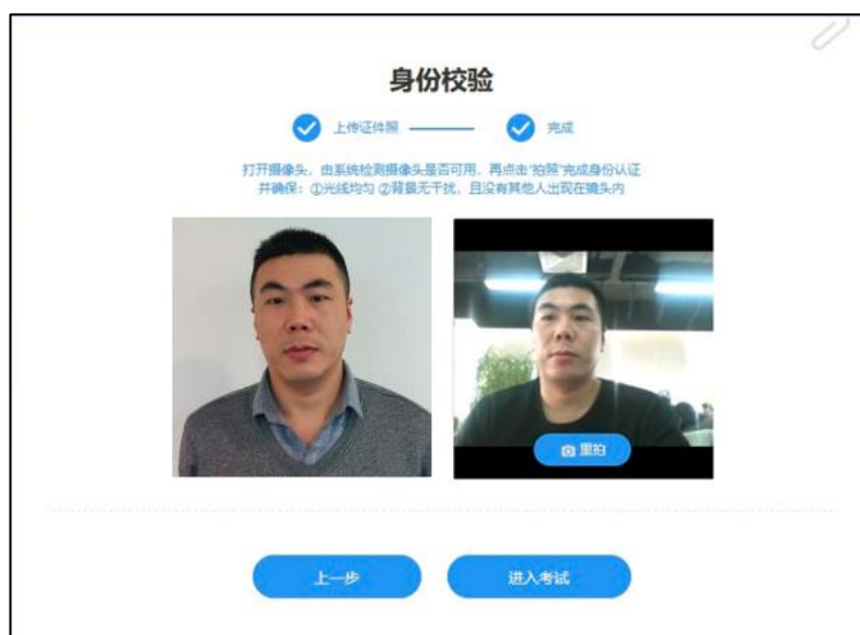
图 3 摄像头拍照认证