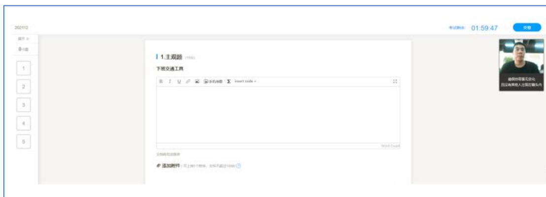
图 4 学生答题页面

摄像头抓拍：学生进行在线考试时，右上角始终有摄像头窗口，系统将进行抓拍（学生无感知）。