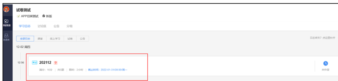
图 1 电脑端网页版试卷入口

学生需登录长江雨课堂网页版为 changjiang.yuketang.cn ，点击右下方的【网页抢先版】进入新版网页，在【我听的课】列表中找到对应的课程班级，已发布的试卷将出现在【学习日志】中，标签为【试卷】。