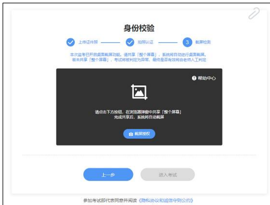
图 7 电脑桌面截屏截屏授权